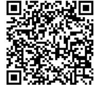
チェックシート QRコード